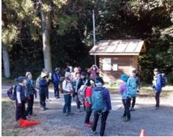
WC 済ませたら出発です