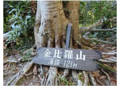
14:50 金毘羅山 121m 通過