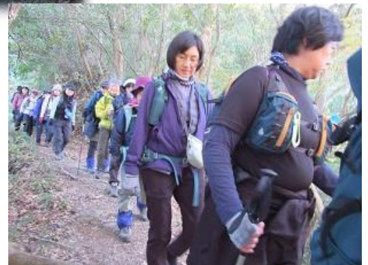
本当にトップが無く 何処までも続く尾根 Yamakara 独占の山だ~