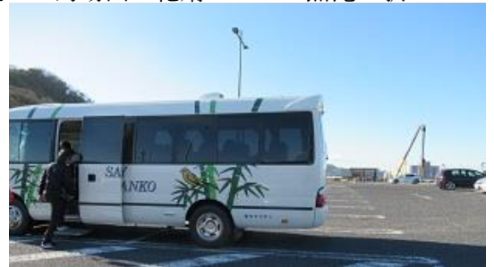
8:40~9:00 アクアライン工事中で仮設 WC 買い物する