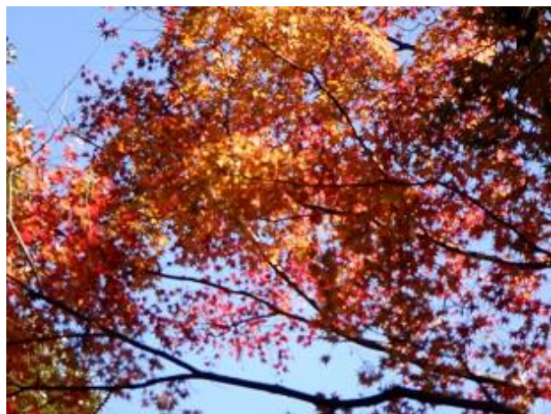
12:24 未だ紅葉きれいです