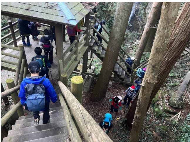
階段降りると黒滝 長者川中流落差 15m