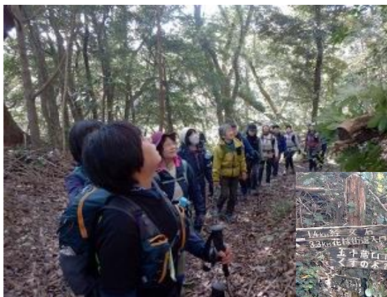
ほんとだ～ 皆の目線は上 12:30 五十蔵分岐 進入禁止ロープ