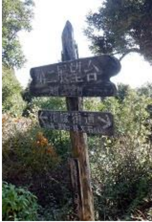
11:38 第二展望台から光る海