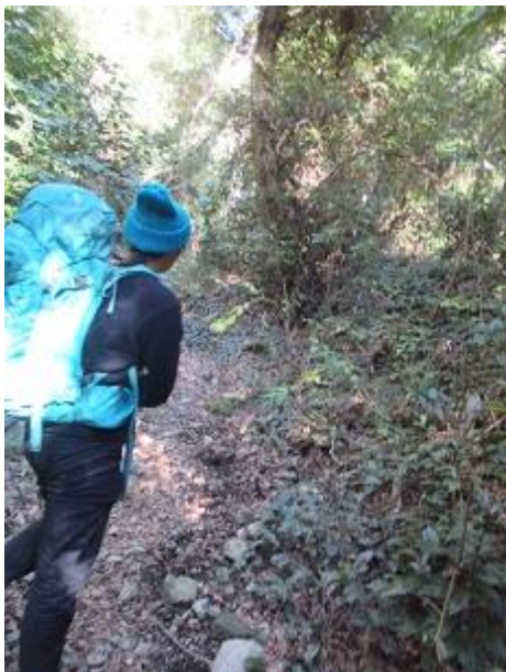
ガイドです 大きな リュックは 当たり前 なのかな～