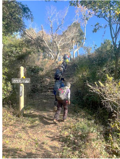
13:28 頂上に 267m 新日本百名山だそう クリスマスイブでサンタの帽子を

カラスバ山 最期の階段を 13:28 頂上には 花嫁の石像 男女年齢問わず 縁結び承ります と書いてある？