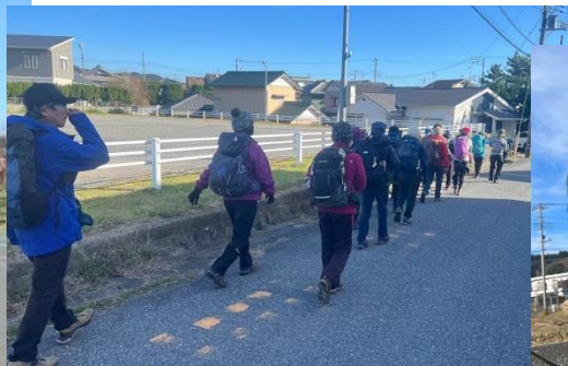
9:55 林道を 30 分歩く もう水仙咲く