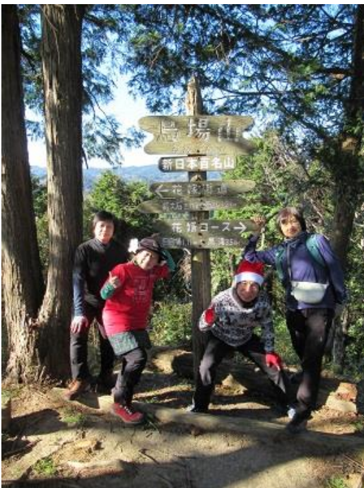
サンタさんが3人思い出の山行 NO5