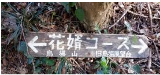
13:45 花婿コースで下山