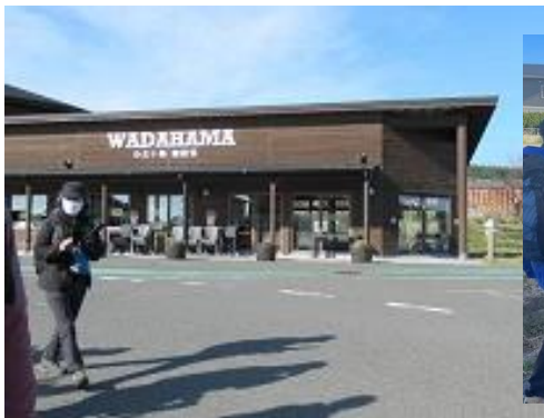
9:53 道の駅わだはま wc