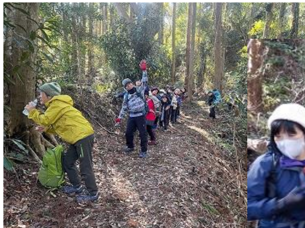
12:42～ 駒返したち休憩 水分補給