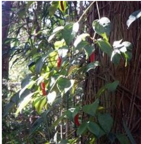
始めから急登赤い実が癒す