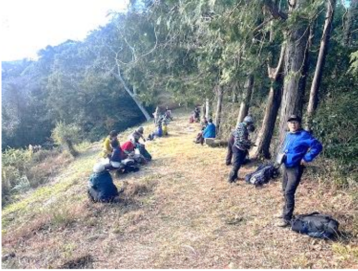
12:48~13:05 お昼だよ～ 素晴らしい場所で15分は短い