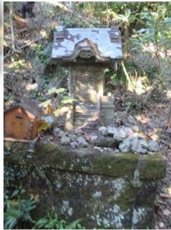
15:01 可愛い祠が 金毘羅神社