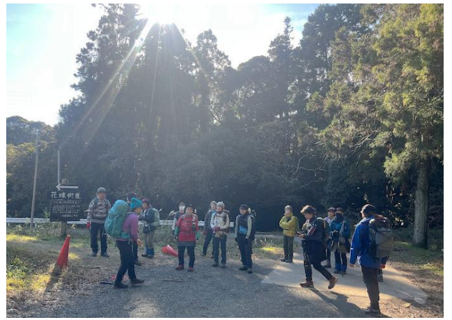
花嫁街道登山口着(横巻の長い道低山ですが片側切れて所も有り注意して登りましょう)