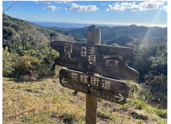
13:17 第三展望台から富士山ぼっち