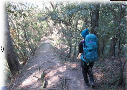
我等も黙々と 歩くのみ