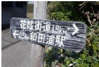
10:07 花嫁街道 1,9 km 表示