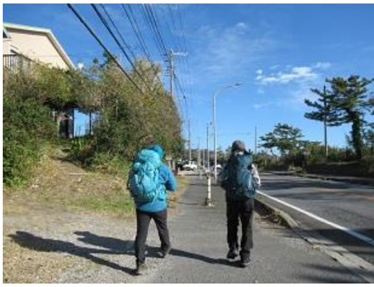
青空のもと登山口迄未だだよ