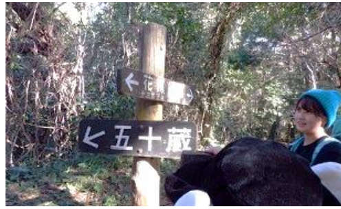
13:21 分岐五十蔵コースは禁止

カラスバ山 最期の階段を 13:28 頂上には 花嫁の石像 男女年齢問わず 縁結び承ります と書いてある？