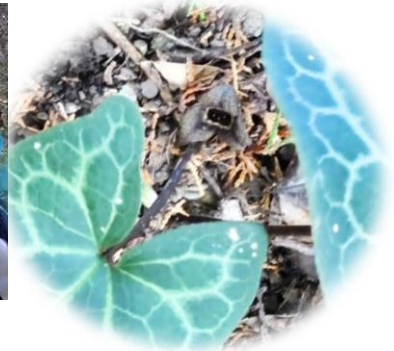
葉が大きいわりに1個の花