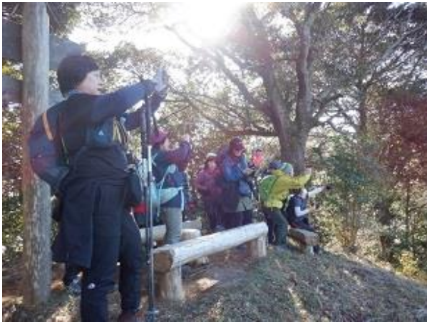
13:16 第三展望台から身を乗り出した