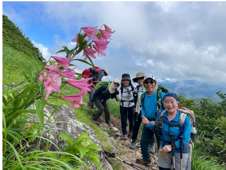
8:50 ヒメサユリの花がさいてるよ～可愛い！綺麗！