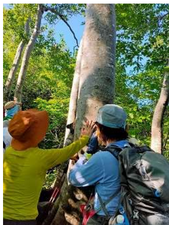
7:31 樹々の説明 冷たい!