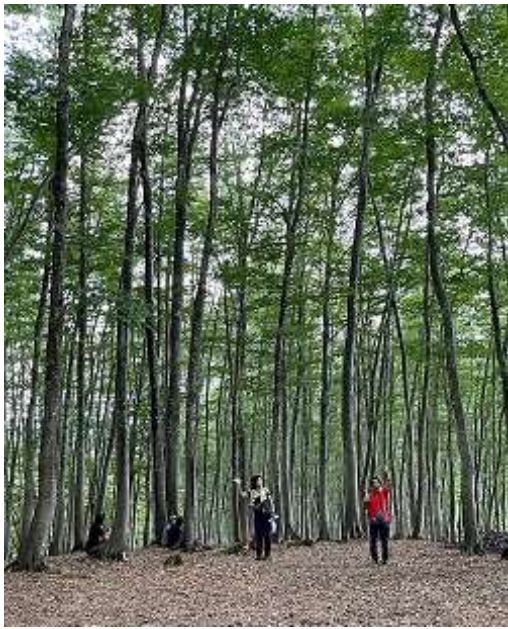
12:40 食事先に済ませてこれから散策の人に「いってらっしゃーい」