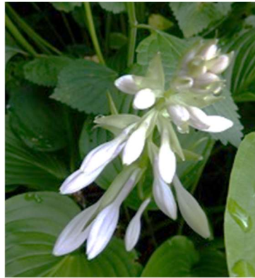
10日前の 下見の折は 未だ足元に 雪残り 御花も 咲いていな かったそう