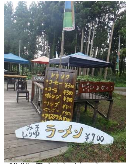
13:00~アイスたべたいね~