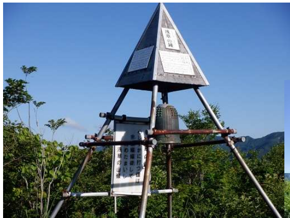
6:55 浅草の鐘の脇には 八海山大神の祠が