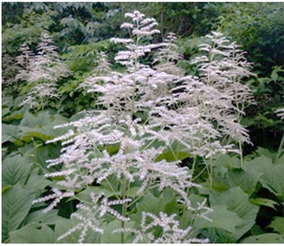
6:15頃からお花がみられる ヤグルマソウの実