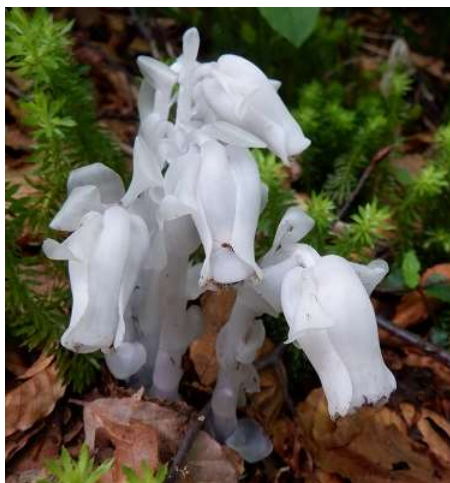
7:43 ギンリョウソウがあちこちに