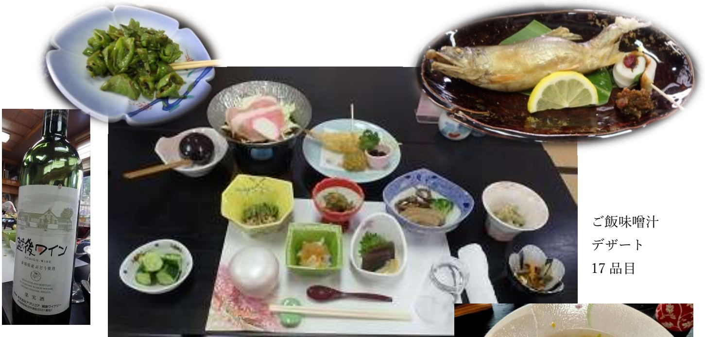
ご飯味噌汁 デザート 17品目