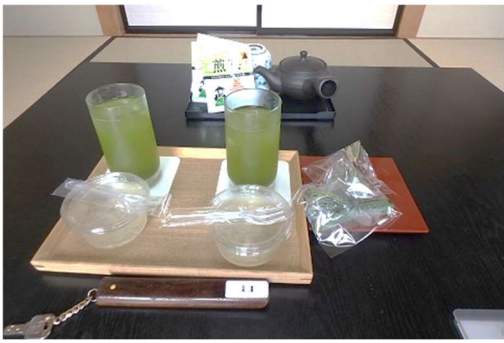
冷たい抹茶梅葛切り笹餅の接待