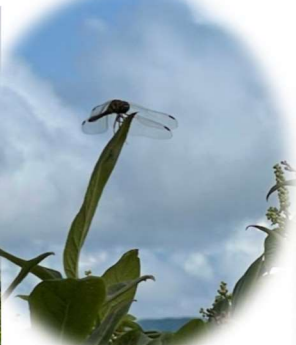
トンボが沢山飛んでる 虫はあまりでないよ～ 雲の動きが忙しい！