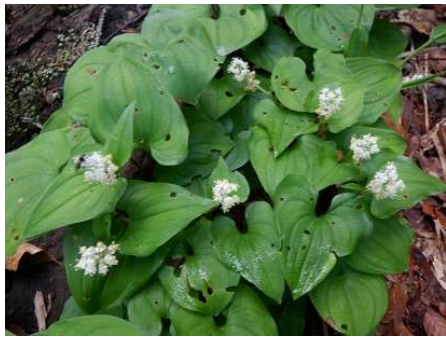
マイズルソウ クレマチス→