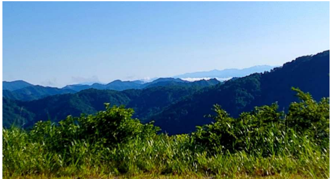
慰霊碑のすぐ脇から 浅草岳への登山口になる