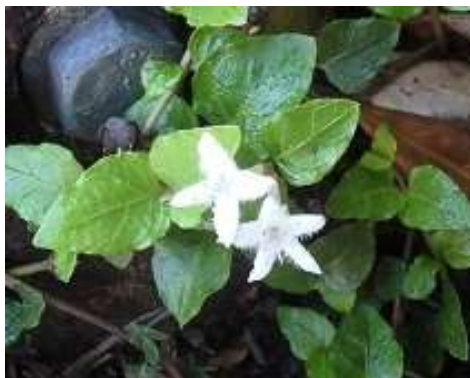
6:55 辺りから足元に必ずペアで 咲いているつるありどうし