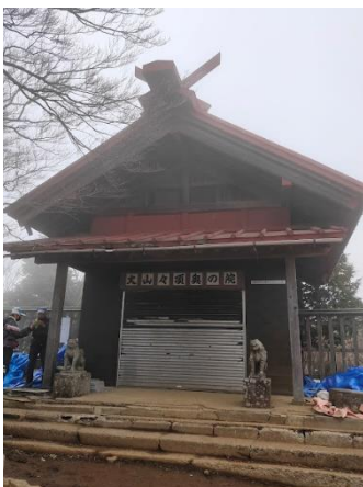
11:16 大山頂上 28 町目 奥之院