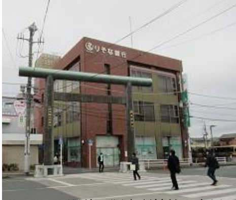
7:55 駅前に阿夫利神社の鳥居

5:27 始発バ48 花小金井ー6:40 小田急ー7:44 伊勢原ー7:50 集合