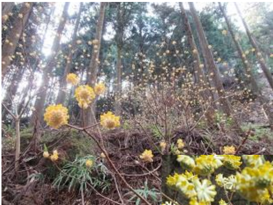
満開になると 花がボンボリのように 丸くなる NO6