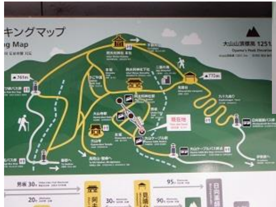
9:00 出発ケーブル駅の地図