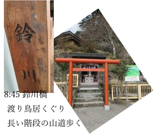
8:45 鈴川橋 渡り鳥居くぐり 長い階段の山道歩く