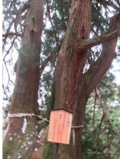
9:48 夫婦杉 500~600年