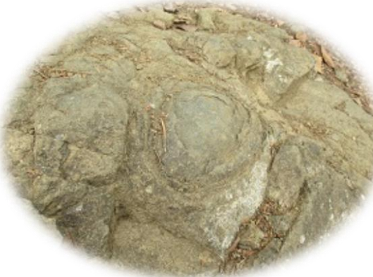
10:16 ボタン岩玉葱岩とも海だった証拠！ 10:21 天狗の鼻突き岩〇穴が？！