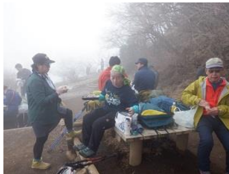
真っ白の頂上付近今にも