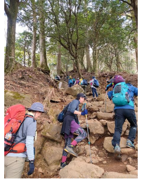
9:55 まだまだ岩ゴロゴロです