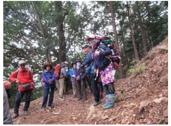
13:43~46 立ち休憩もう少し!