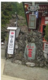
9:25 門をくぐり 頂上登山口 いきなりの階段です