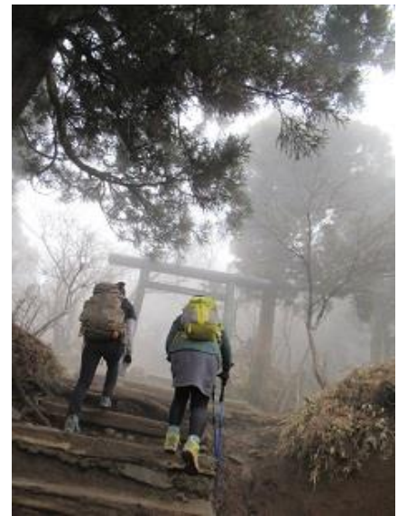
11:11 鳥居が見えてきた