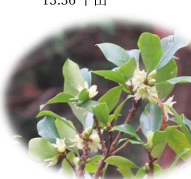
13:47 シキミの花見つけ