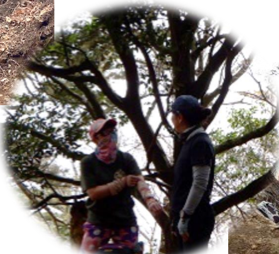
10:05~13 休憩 お二人は秘密会議？