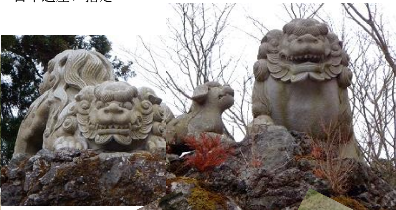
十二支を従えた 狛犬家族が 守ってます