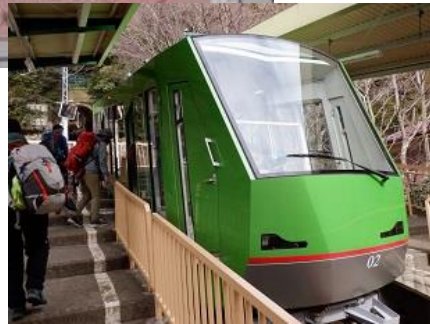
6分間の ケーブル 乗車