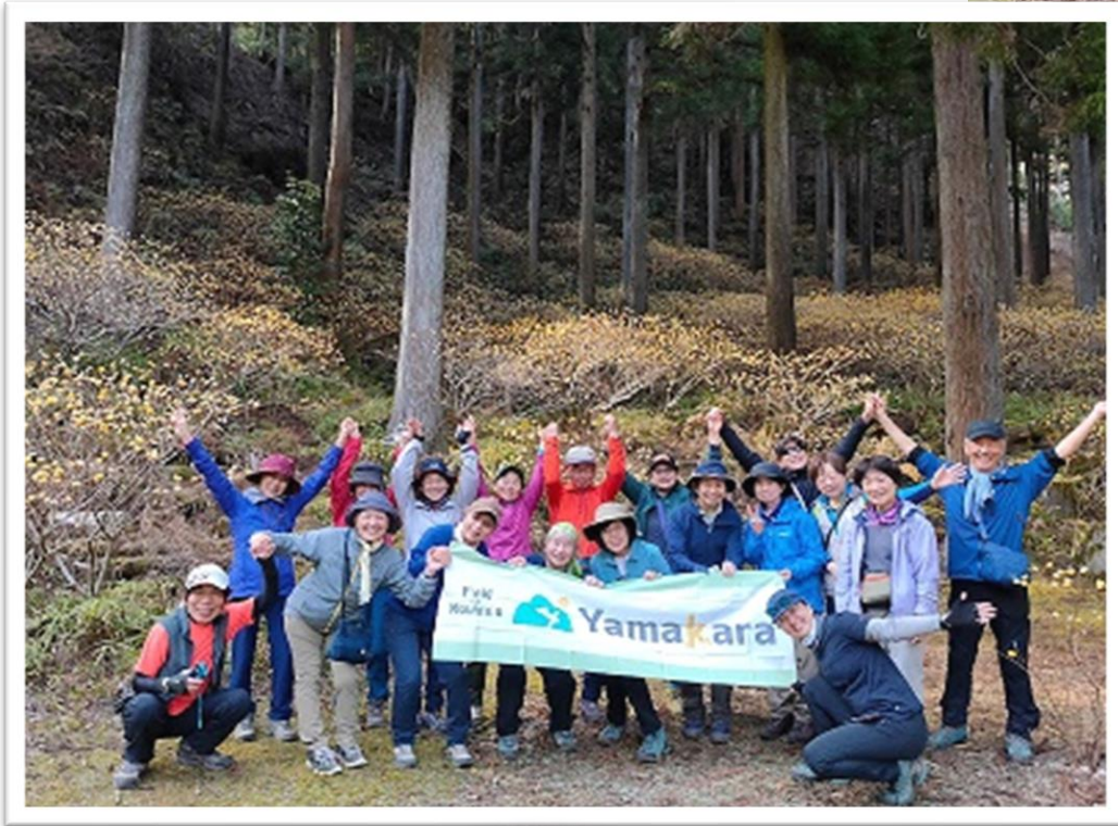
14:50 名残惜しいが出発です