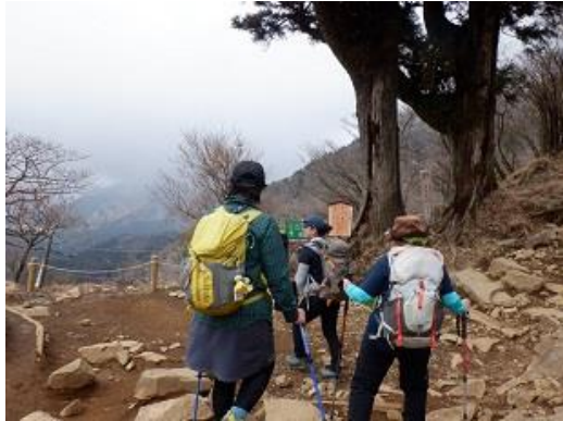
10:41 富士見台 20 町目薄っすら富士山見えるよ 誤報流したの誰~