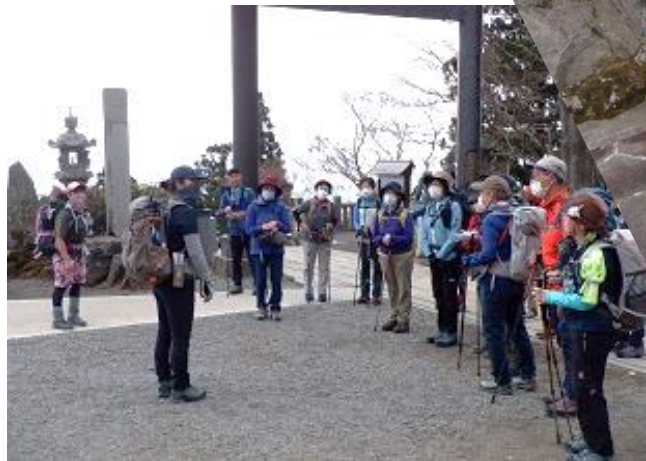
9:20 御朱印,WC タイム準備して今日のご挨拶