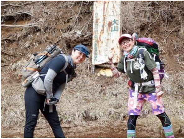
10:29~35 休憩 我等腰掛二人は余裕の笑顔