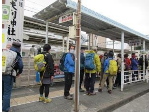
8:02 発バス待ち 久しぶりの方向何人か