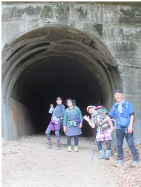
最終組もやっと通り抜ける