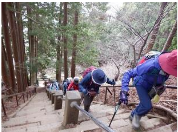
9:29 最初の階段 登り切りました これから 本格的に登山 ですよ～NO2