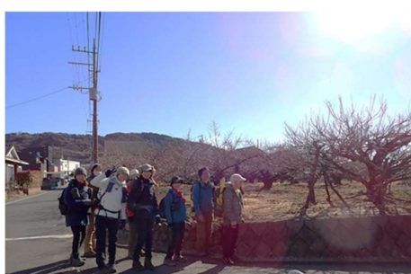
未だ少しはやいようです