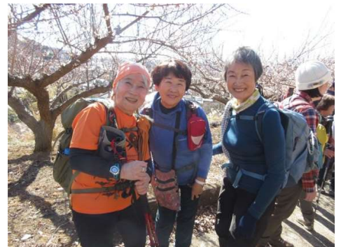
10:41 お久しぶりですね