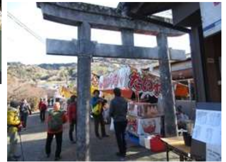
これから山登りリュック重くなる