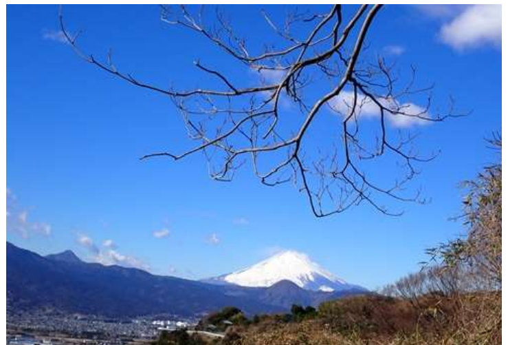
青空、綿菓子雲、真白な富士山左手には金時山