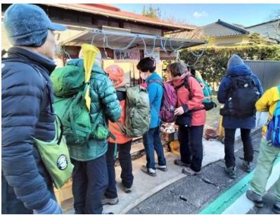
9:33 最初の買い物 みかん