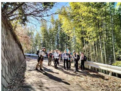
10:56 立ち休憩 未だ舗装路だ～