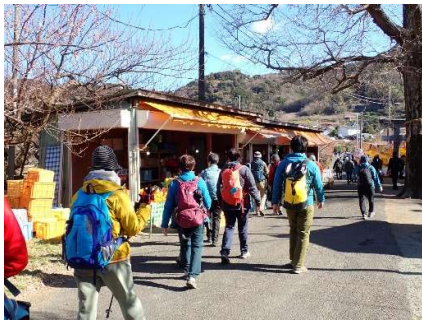
貸しゴザがあったり湘南ゴールドも お買い物しっかりして登山