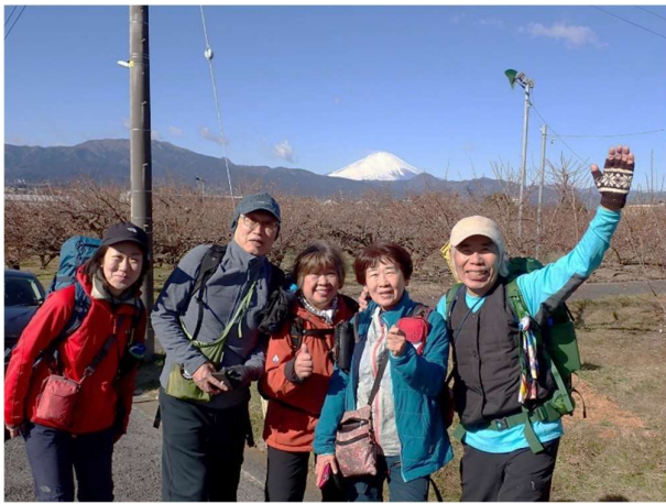
9:58 富士山笑顔ですよ