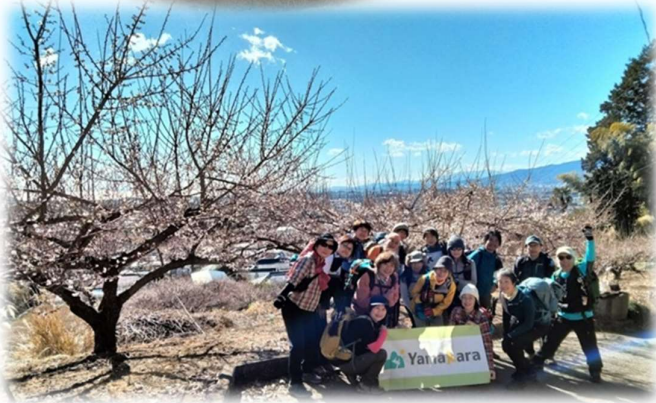
10:42 満開で無いけどここで全員写真撮りましょう