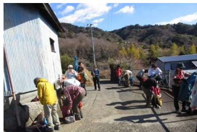
10:33 舗装路登ってきました休憩